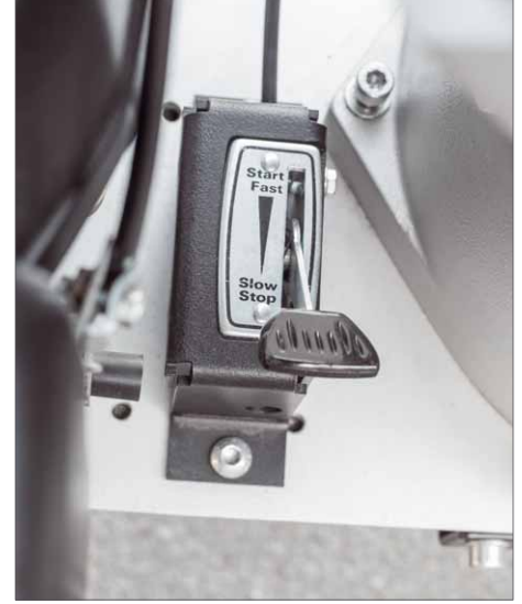
Einfacher geht's kaum. Ein einziger Hebel genügt für die Motorsteuerung

M it dem TH 8008 B bietet Elektra Beckum für den mobilen Einsatz genau das richtige Gerät an. Unabhängig von Strom und dank großer Räder sehr mobil, ist die Maschine schnell an Ort und Stelle gebracht und sofort einsatzbereit.