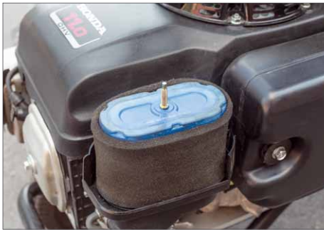
Wartungsfreundlich: Der Schaumstoff-Luftfilter ist wiederverwendbar