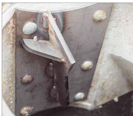
Wie die anderen Bauteile ist auch das Gegenlager für das Häckselgut massiv ausgeführt und bei Bedarf austauschbar