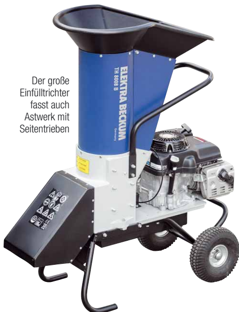
Der große Einfülltrichter fasst auch Astwerk mit Seitentrieben